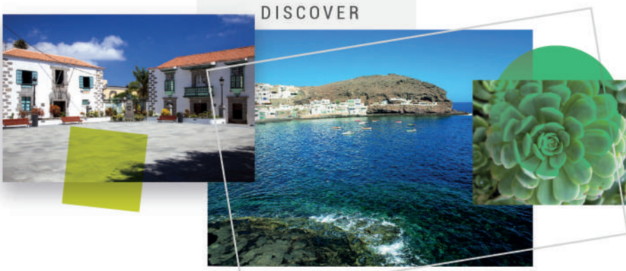
DESCUBRE ----- DISCOVER