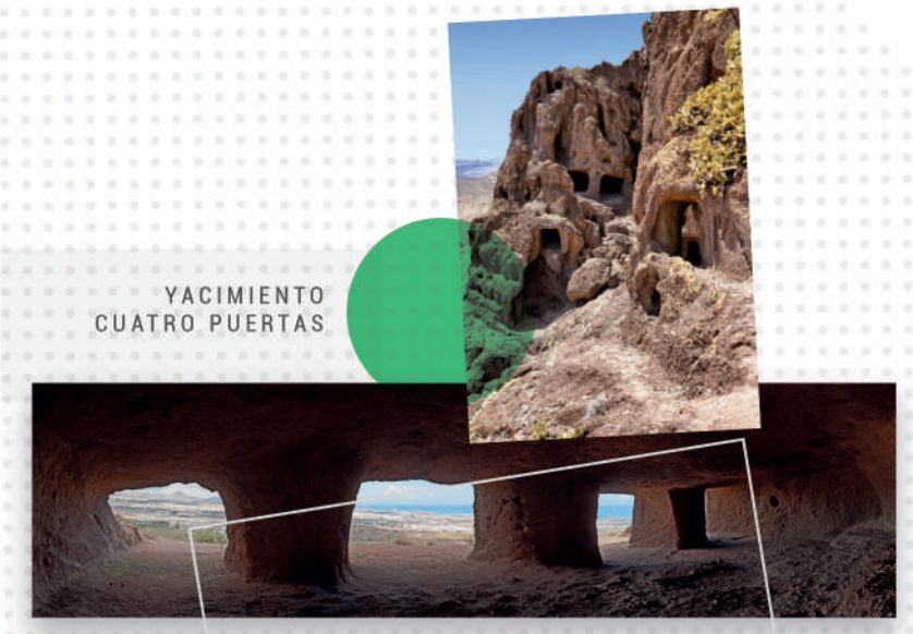
YACIMIENTO CUATRO PUERTAS

36 90 Desde / From Maspalomas: salidas cada / departures every 60 min.