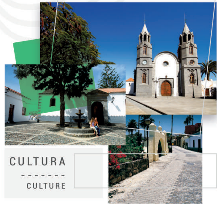
CULTURA ----- CULTURE

Unique settings for your favourite out-door sport, over one hundred pre-Hispanic archaeological sites, fantastic beaches, shopping areas with unbeatable leisure and shopping opportunities and a larder stocked from the mountains and the sea to offer an extraordinary cuisine. Let Telde put its spell on you!