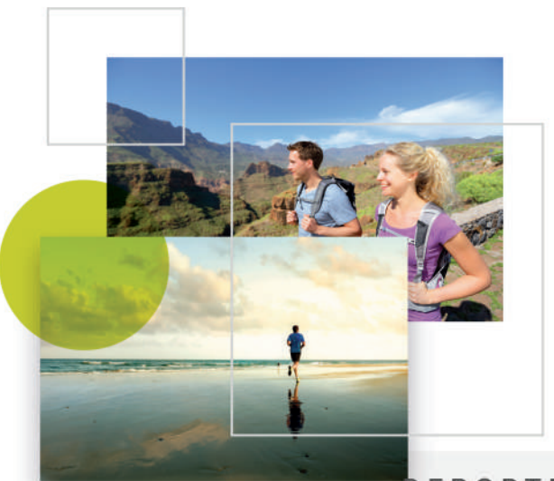
DEPORTES ----- SPORTS